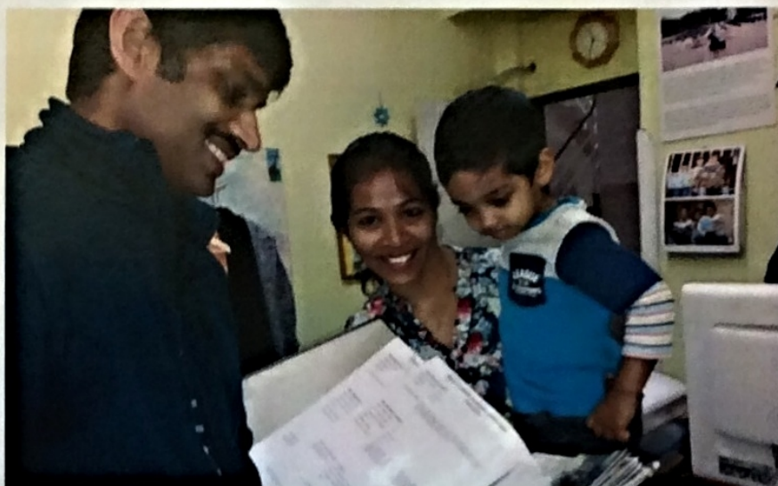
Venee s rodinou v kontaktní kanceláři Arcidiecézní charity Praha vybírání dítě, které podpoří na dálku.

Jako dítěti z dětského domova by ji v indické společnosti příliš radostná budoucnost nečekala. Začátkem devadesátých let pražská Arcidiecézní charita právě začínala s projektem Adopce na dálku. Nadané dívce tehdy začala pomáhat „adoptivní“ maminka