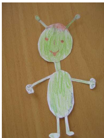
A. Sochová – 1. tř.