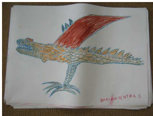
D. Richter -1. tř.