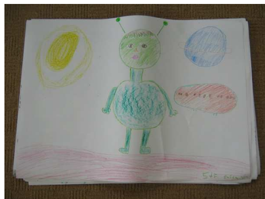
E. Vémolová – 5. tř.